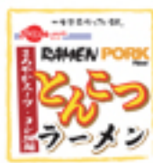
Sun Noodle (page 4)

Sun Noodle 在美國忠實呈現了日本原味，風味醇厚的麵條泡在湯裡十分鐘也不會變軟，醬油、味噌和豬骨三種口味保證讓你吃得大呼過癮。