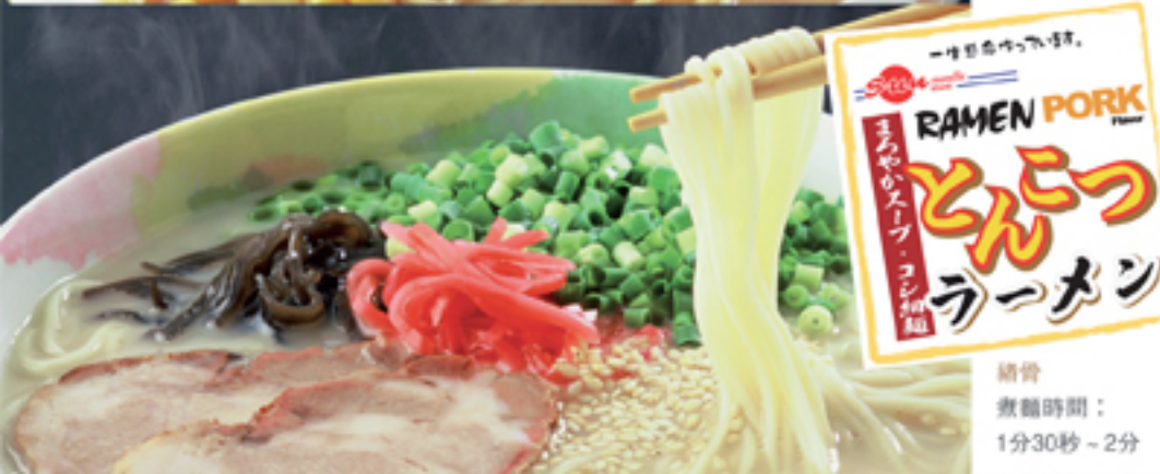
豬骨 煮麵時間： 1分30秒～2分