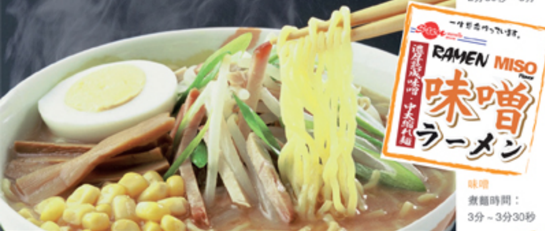
味噌 煮麵時間： 3分～3分30秒