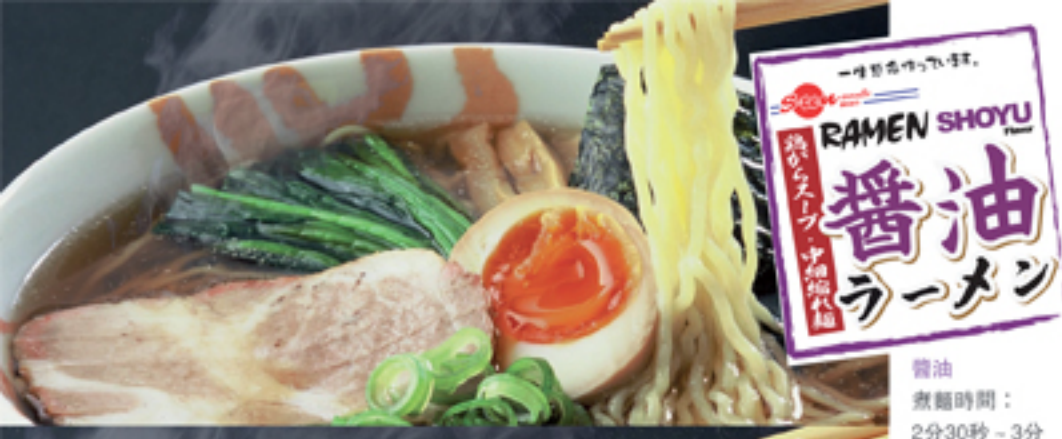
醬油 煮麵時間： 2分30秒～3分