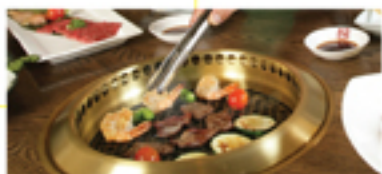
Gyu-Kaku (page 6)

J-goods裡面的各家企業決定要送個超大紅包給各位讀者快來試試看今年手氣如何吧！▶詳情請參閱第16頁